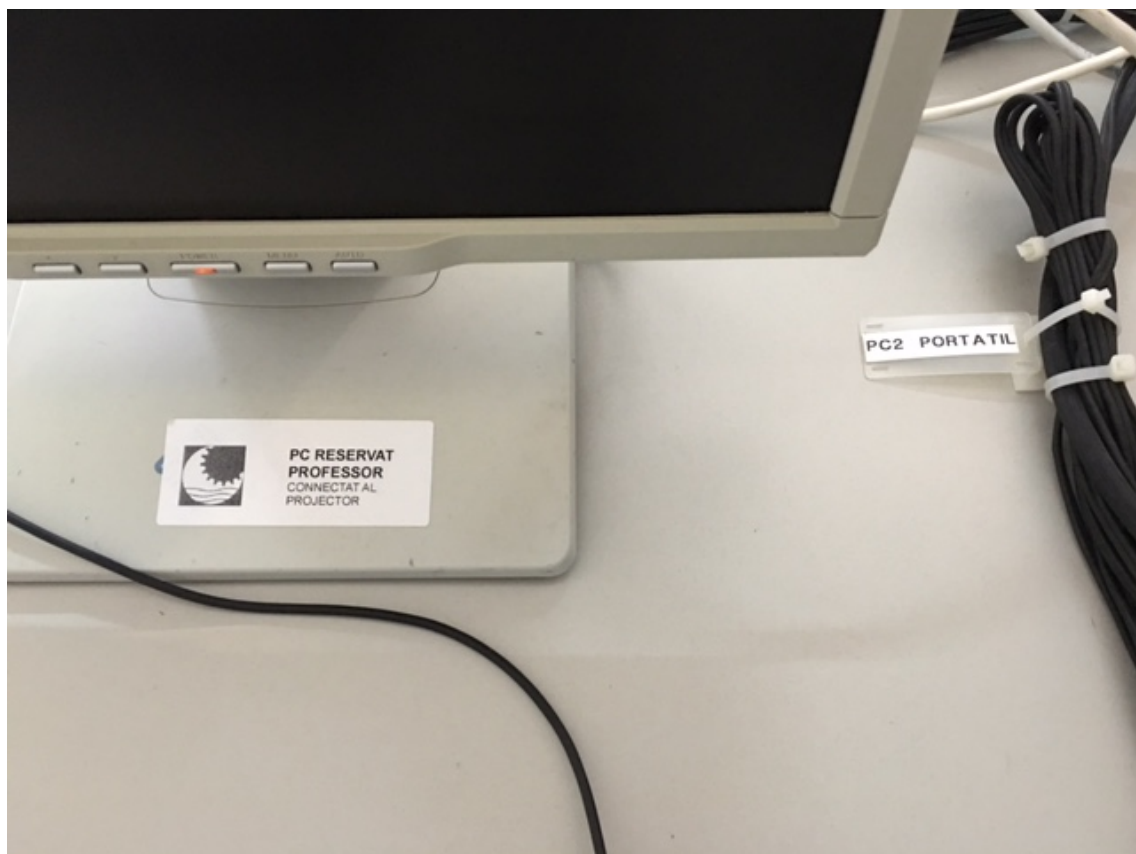
Fig.4: Detall d'etiquetatge i cablejat equip per professor.