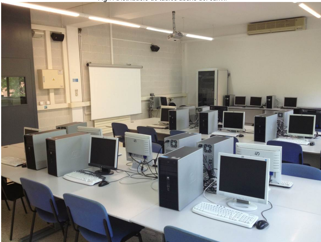
Fig.8: Distribució de taules i projecció abans del canvi.

Aula al112 després dels canvis i millores: