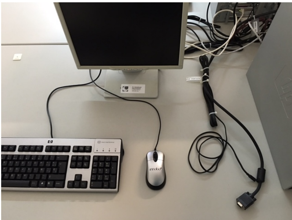
Fig.3: Millora en el cablejat i etiquetatge d'equips.