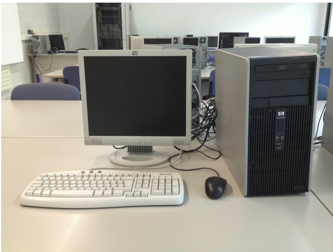
Fig.6: Ordinador de la AI112 abans del canvi.