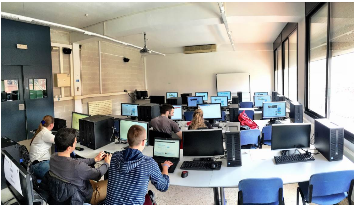
Fig.10: sistema de projecció a la part frontal.