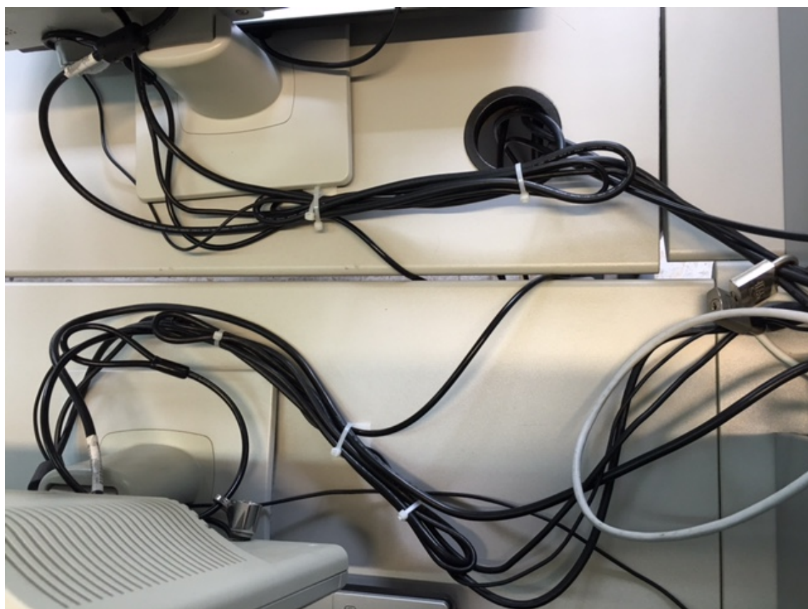
Fig.5: Detall de millora de cablejat d'aules.