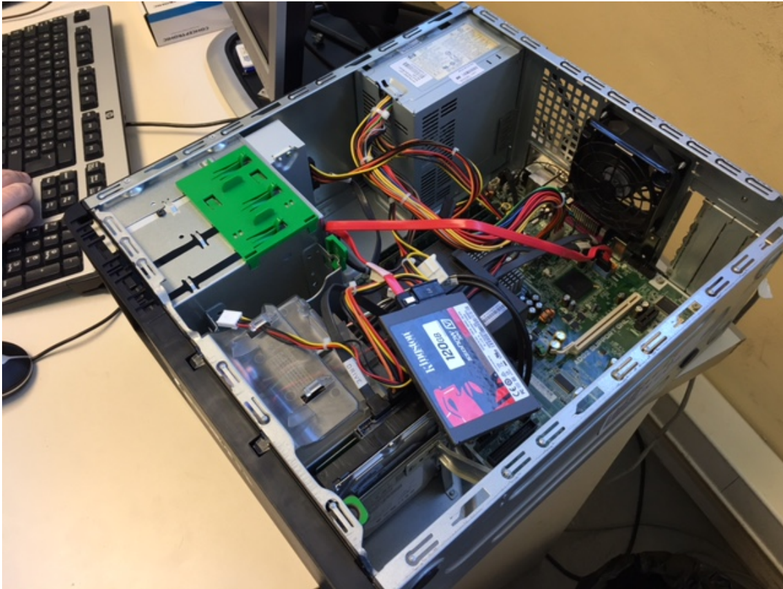
Fig. 1: Ordinador netejat i en procés de revisió