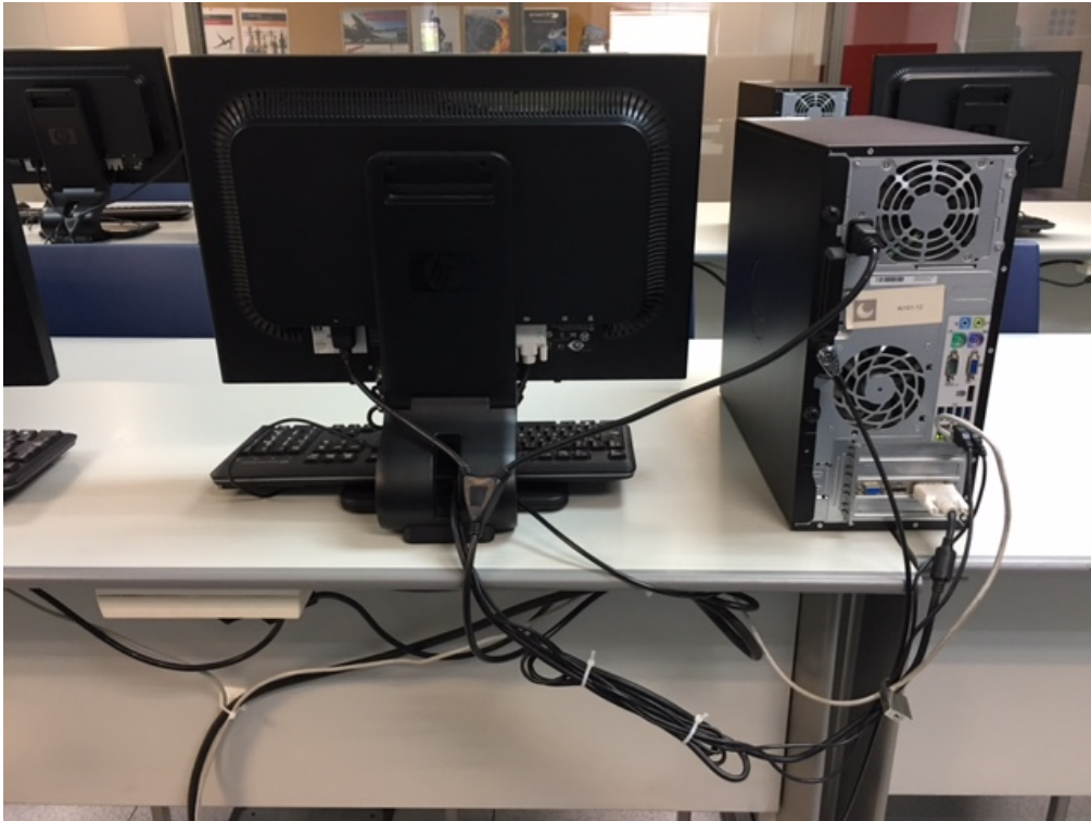
Fig.2: Millores en el cablejat dels equips d'aules