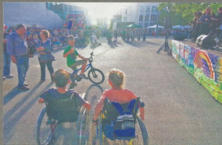
La Festa per una Societat Inclusiva torna el 27 de maig. SIDRU C.

Aquest any, la Festa tindrà lloc al parc de Baix a Mar, amb la periodista Mònica Terribas com a padrina de l'acte.